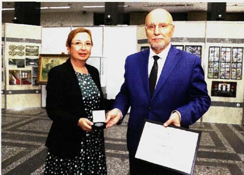
В края на юни управителят Димитър Радев откри изложба, посветена на 145-ата годишнина от основаването на БНБ. По време на събитието той бе удостоен с Почетния знак на Икономическия и социален съвет от председателя на ИСС Зорница Русинова

- Да го завършим успешно. При подходяща политическа рамка и при степенна техническа готовност, която имаме, това е напълно пости-